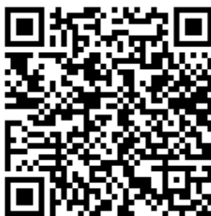
Figura 2: Qr-code de acesso a planilha de cálculo de PCD

Aponta para https://docs.google.com/spreadsheets/d/1R-cgBqB-6Zo5vDtexEBHu9S0NNcu1bLOvJa-o12lmYE/edit?usp=sharing .